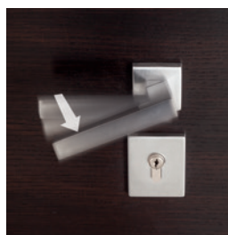
Apertura rápida desde el interior actuando sobre el mango.